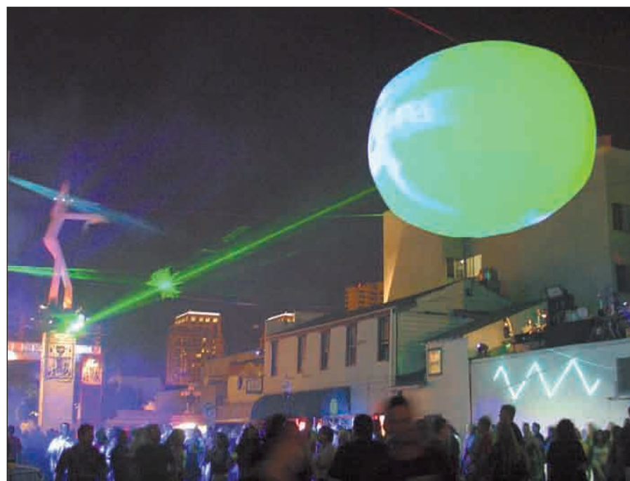
Spettacolo con raggi laser