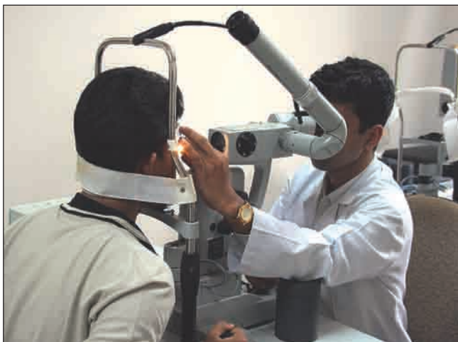
Trattamento laser retinico