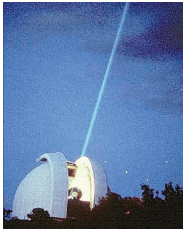
Fascio laser proiettato sulla luna a scopo di studio

“L'OCCHIO È UNO STRUMENTO OTTICO CHE CONCENTRA IL FASCIO LASER IN UN PUNTO DELLA RETINA”